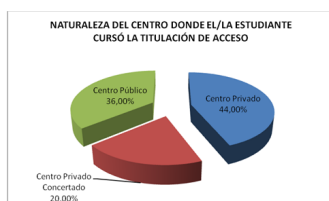
Gráfico 2.1. Naturaleza del centro en que los/as estudiantes encuestados cursaron el estudio de acceso.

Otro aspecto reseñable, especialmente en su evolución, es la nota media con la que el alumno accede a los estudios universitarios desde Prueba de Acceso (Tabla 2.6). Para este curso académico, la nota media de los estudiantes que acceden a través de las Pruebas de Acceso a la Universidad se sitúa en un 8,40, valor muy cercano al 8,45 del año anterior. Se mantiene por tanto una nota media destacada, que ofrece una tendencia sostenida en los últimos años, que debe revertir en altas tasas de éxito.